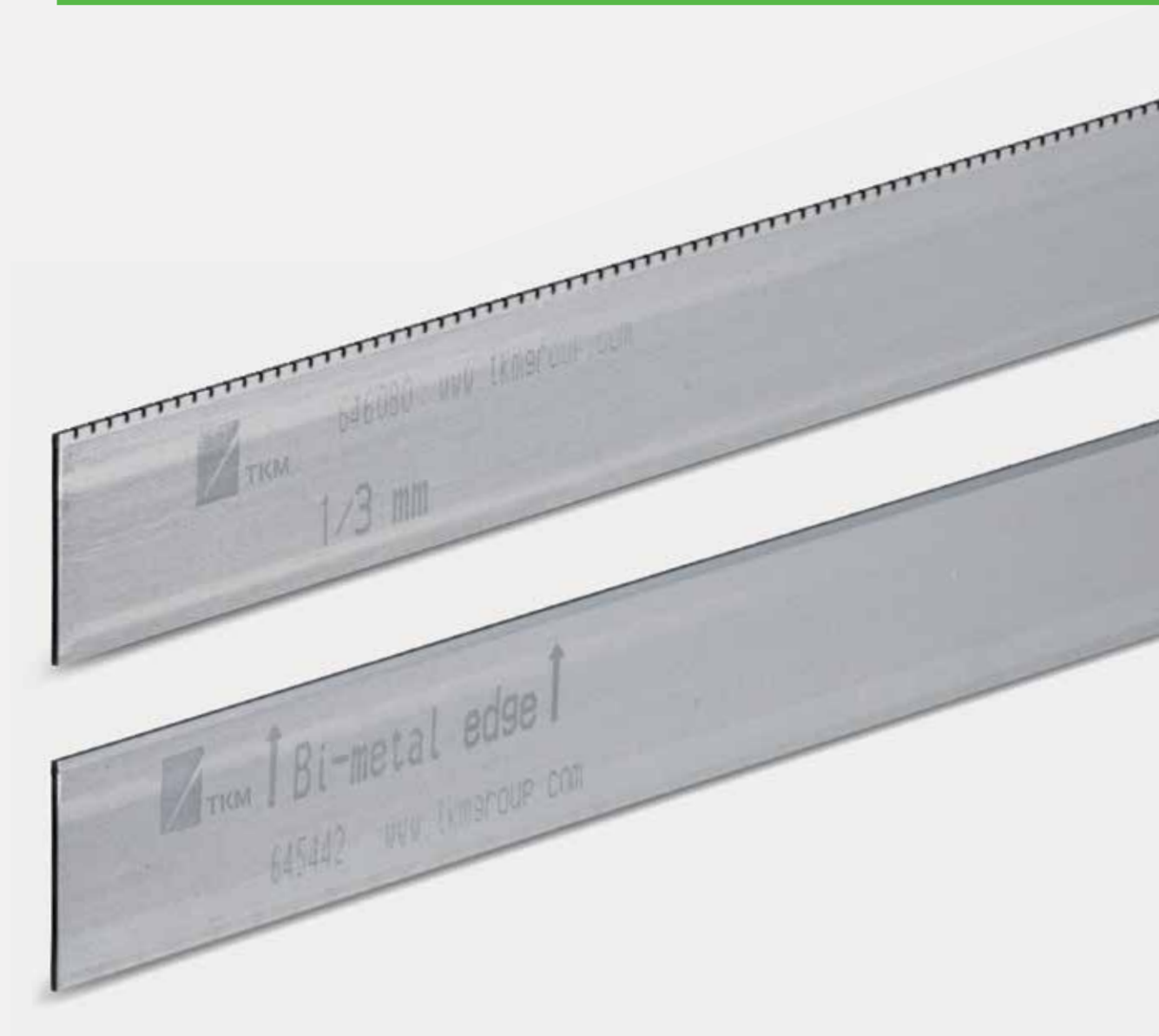
Perforier- und Gegenmesser für alle aktuellen Maschinen.