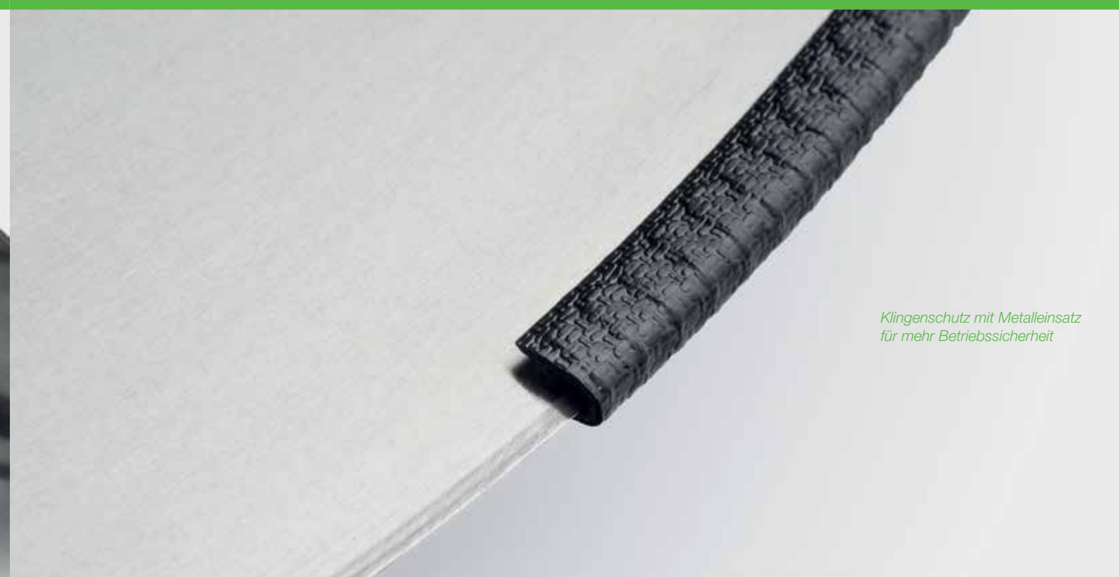
Klingenschutz mit Metalleinsatz für mehr Betriebssicherheit