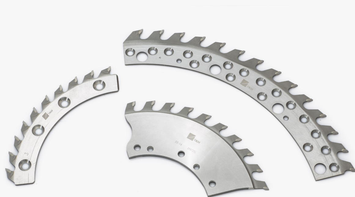
Zerspanersegmente und -Ringe

Für unsere Zerspannersegmente und –Ringe gelten daher die gleichen anspruchsvollen Fertigungsstandards wie für unsere Kreissägen. Dadurch sind wir in der Lage diese in sämtlichen gewünschten Ausführungen und für alle bekannten Maschinenhersteller zu liefern.